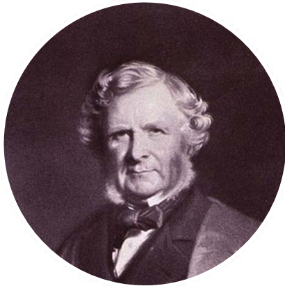
Erasmus Wilson profesor Oxfordu

„When the Paris Exhibition closes, electric light will close with it and no more be heard of.“ (1878)