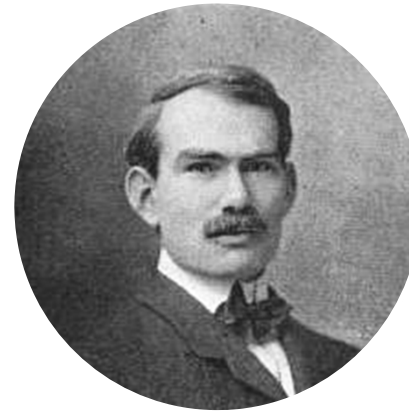
Lee de Forest americký vynálezce

„While theoretically and technically television may be feasible, commercially and financially it is an impossibility.“ (1926)