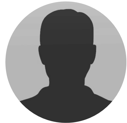
Neznámý český pojistný matematik

„Klienti nemusí přesně vědět, kolik se sráží z jejich podílového účtu, hlavně když je to podle mého vzorečku správně.“ (2015)